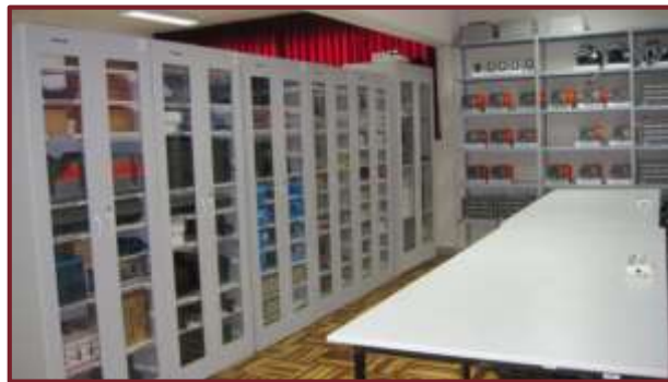
Laboratorio de Circuitos y Electrónica Industrial