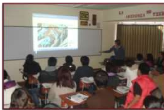
Diplomado Formulación y Evaluación de proyectos - SNIP