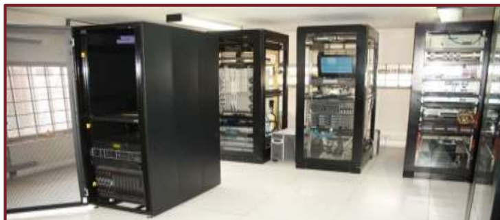
CENTRO DE DATOS