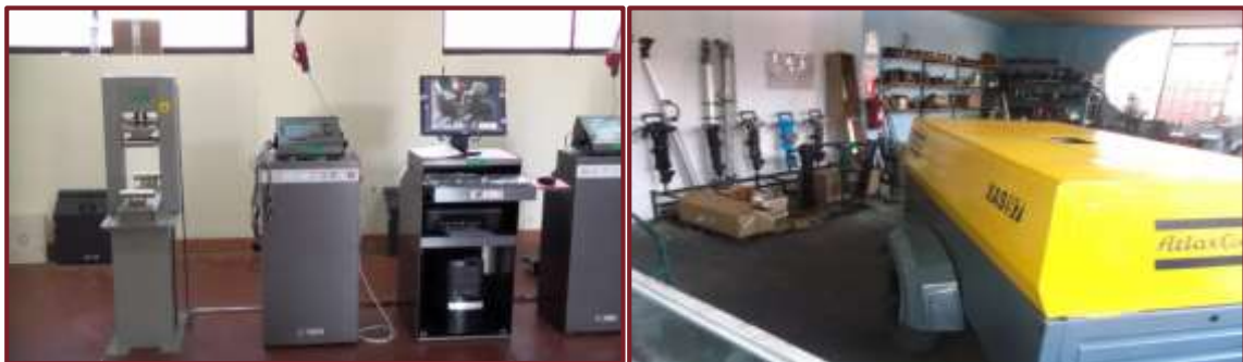
Laboratorio de Mecánica de Rocas