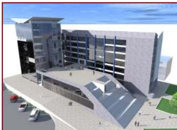
ar Paredes Pando

Tiene su origen desde el año de 1942 como Sección de Historia y Antropología, como Facultad de Ciencias Humanas desde 1974 y denominada como Facultad de Ciencias Sociales desde 1986.