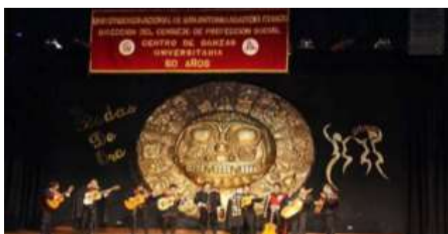
Estudiantina Universitaria Chumbivilcana