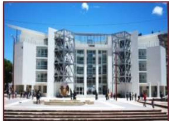
Pabellón de Ciencias Administrativas