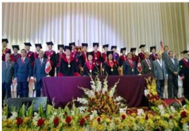
Sesión Extraordinaria de Consejo Universitario por Aniversario Institucional

Actividades programadas por la Oficina de Comunicaciones y Relaciones Públicas, teniendo como objetivo primordial “Fortalecer la Imagen Institucional de la UNSAAC, a través del reconocimiento de la Comunidad Universitaria y a la vez reforzar la identidad universitaria” .