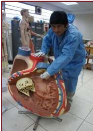
Simuladores para las clases prácticas