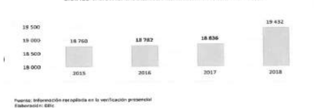
GRÁFICO 4. CANTIDAD DE ESTUDIANTES MATRICULADOS 2015-2018

A continuación, el gráfico muestra el crecimiento de la cantidad de estudiantes en los últimos cuatro (4) años.